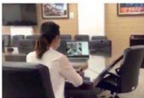
图3：侧后方第二机位效果图

注： 建议正前方第一机位使用电脑，侧后方第二机位使用手机或笔记本电脑；若使用手机进行面试（无论第一机位或第二机位），均须提前办理呼叫转移，以免复试过程被来电打断影响面试成绩。同时，考生需保证报考时所填报的手机号畅通，以便考务人员进行紧急联系。报考时所填手机作为应急联络使用，不得作为面试设备，不得干扰面试过程。