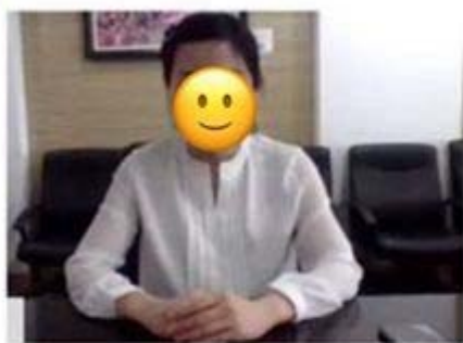
图2：正前方第一机位效果图